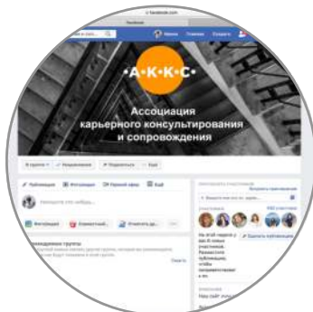
Социальные сети и мессенджер