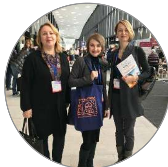
Выступление на проф. мероприятиях