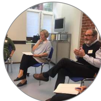
Обучение и интервизия