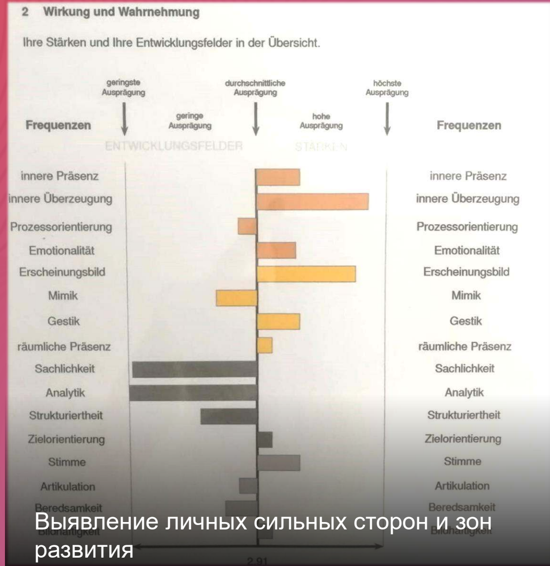
Выявление личных сильных сторон и зон развития